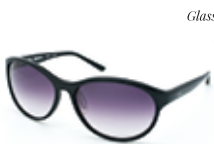
spec espace ESS9013-1 ¥27,000(税込)

顔を覆う設計で偏光レンズの効果を最大に引き出し、調節可能なシリコンパッドが顔にジャストフィット。洗練されたデザインで街着とも違和感がありません。